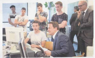
Interviewer verlässt Premier Bettel die Arbeiter der Schüler am Computer

Auf Modernität und Innovation setzen, bedeutet letzten auf Traditionen zu verzichten. Im Jahre 2019 hat das Lycée du Nord mit einem halben Jahrhundert Erfahrung und Kontinuität in der Ausbildung, sondern auch im Coaching von Studenten. So ist das LNW in der Lage, die verschiedenen Jugendlichen zu helfen, die verschiedenen Vorkursen und den notwendigen Fähigkeiten, um ein Studium im Bachelor oder den Zugang zur Arbeitswelt zu schaffen.