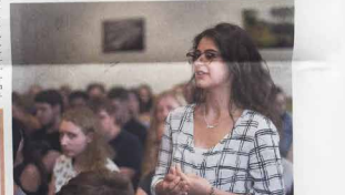
Die Schüler/innen des LNW bringen sich in die Diskussion ein. In einem Bereich eingeladen. Nach dem Rundgang durch das Gebäude traf Bettel zu einem angeregten Meinungsaustausch über aktuelle Themen mit den Schülern des LNW zusammen. ■