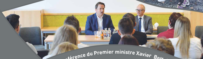
Conférence du Premier ministre Xavier Bettel